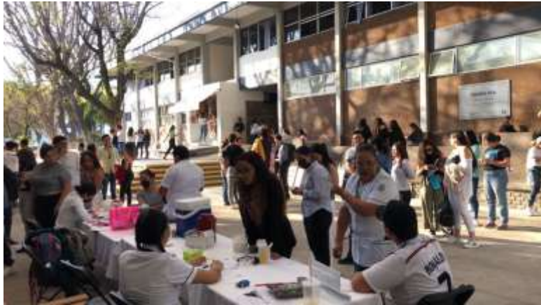
JORNADA DE SALUD FCA ORGANIZADA POR LOS ALUMNOS DE LGDES