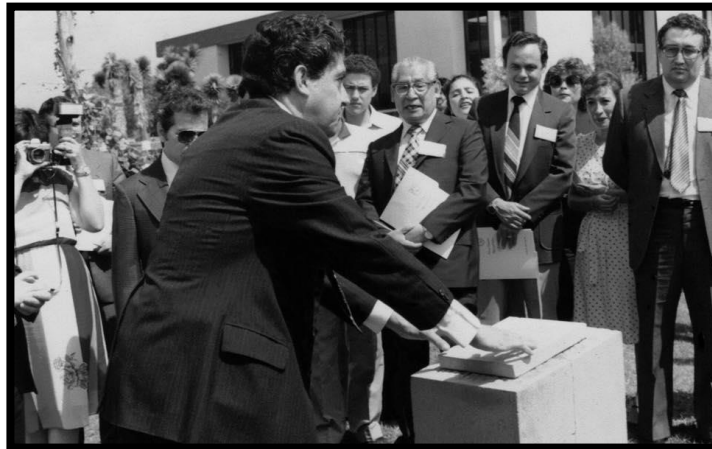
Primera piedra de monumento a la autonomía