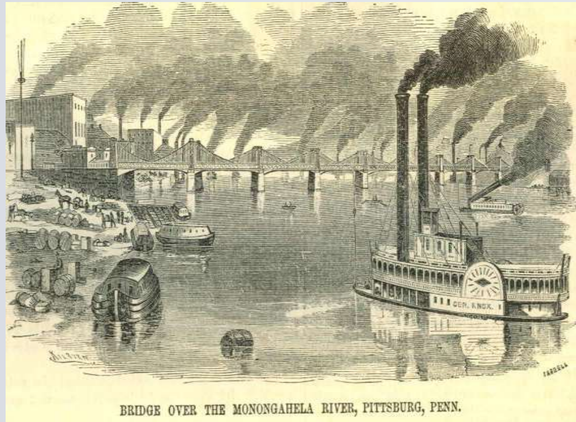
BRIDGE OVER THE MONONGAHELA RIVER, PITTSBURG, PENN.

El cooperativismo tuvo sus orígenes en el siglo XIX, después de la Revolución Industrial que había tenido su periodo de mayor auge entre 1760 – 1825.